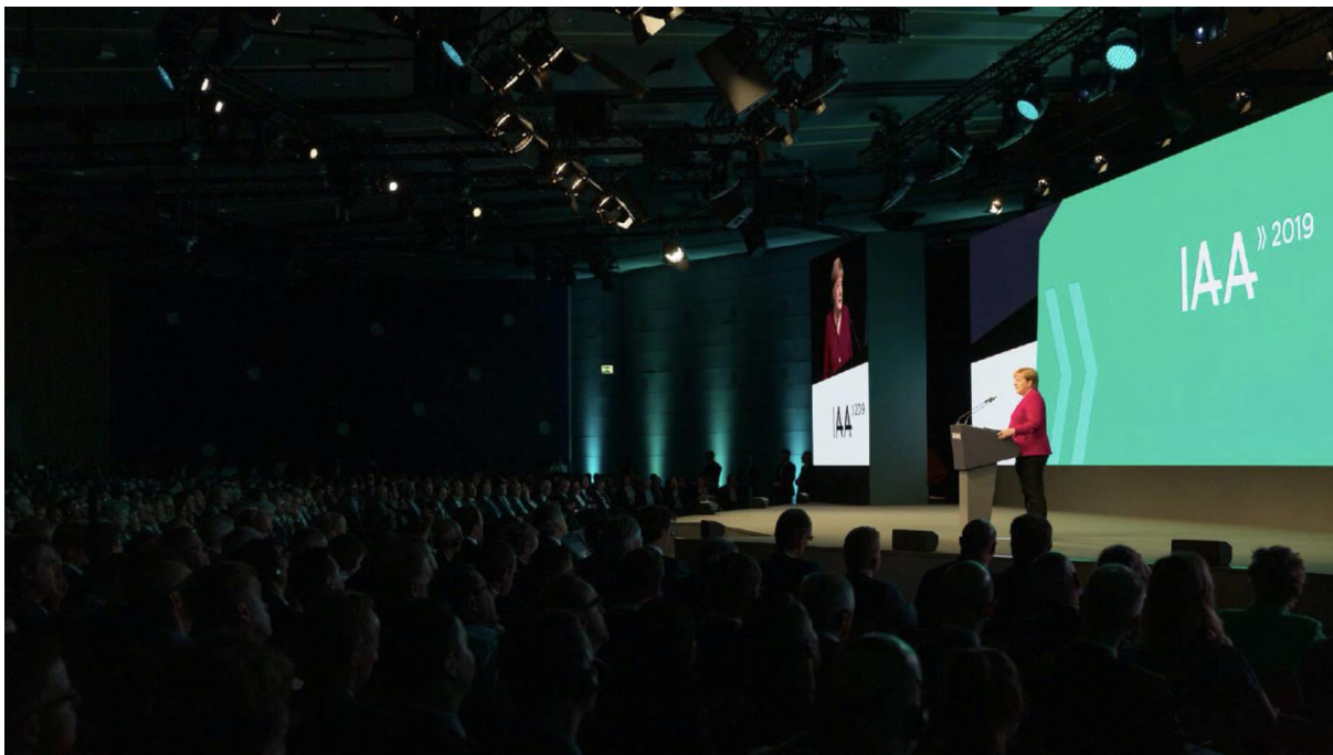
(Bild: Conference-Bühne 2019, Eröffnungsfeier, dient der Illustration)

Die IAA behält sich vor, die Nachfrage an Pressekonferenzen sowie die voranschreitende Programmplanung der IAA Conference, in die Presseaktivitäten sowie Bühnen-Planung miteinzubeziehen. Die Anmeldungen gelten demnach vorbehaltlich Änderungen.