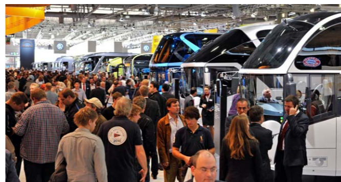
Interesse der Fachbesucher 2010 Interest of Trade Visitors 2010